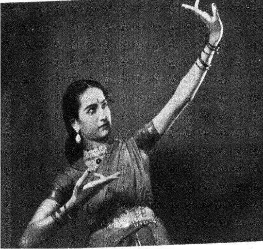
भरतनाट्य नृत्यपद्धति [ 'अनामिका' ]